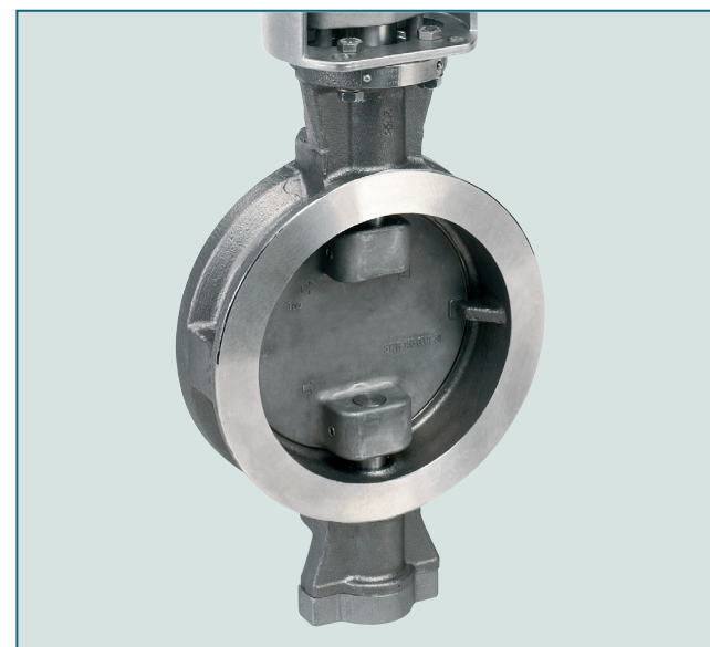
Конструкция двухсоставного вала обеспечивает лучшие характеристики потока до номинального давления 19 бар.