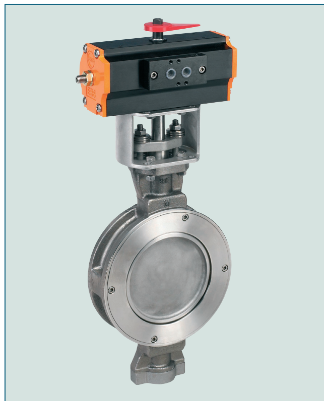
Межфланцевый затвор двухэксцентриковой конструкции. Надежное перекрытие потока даже при экстремальных температурах и давлениях.